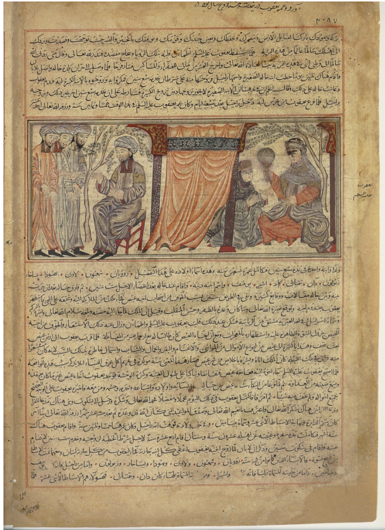
صفحه‌ای از تحریر عربی جامع‌التواریخ