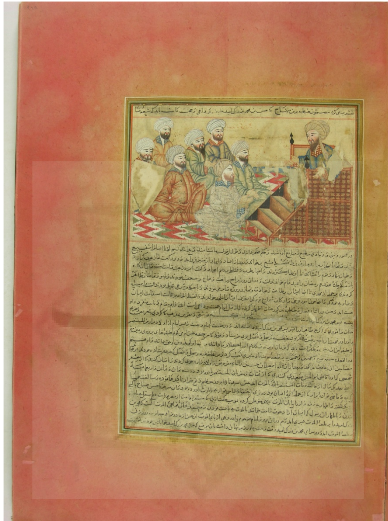
صفحه‌ای از تحریر فارسی جامع‌التواریخ