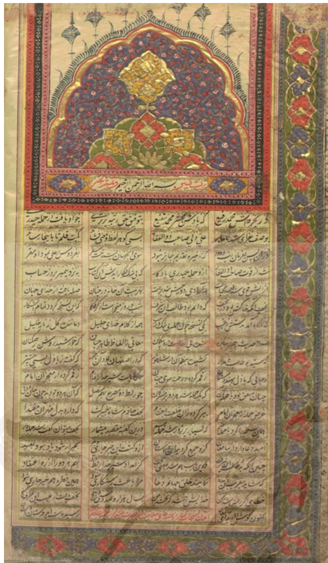
صفحة اول نسخه کتابخانه ملی با علامت مل (ابیات این صفحه همان «سرآغاز نجف» است)