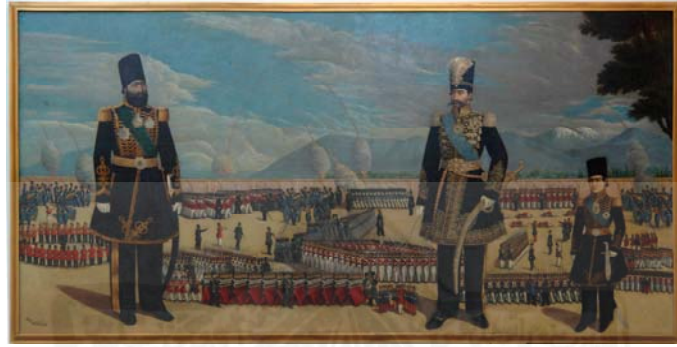
بازدید ناصرالدین شاه از مشق نظامی به همراه سپهسالار و ولیعهد، منسوب به محمدحسن افشار، نیمه دوم قرن ۱۳، موزه ملک.