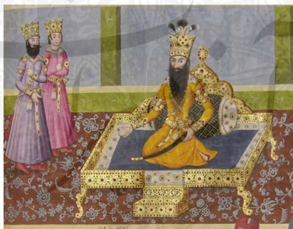
شهنشاهنامه، کتابخانه ملک، رقم محمدحسن افسار، ۱۲۵۹ ق.