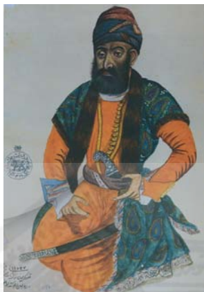
تصویر کریم خان زند، موزه ملی ایران، گنجینه دوران اسلامی.