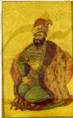
کریم خان زند، موزه ملک، رقم محمدحسن افشار.