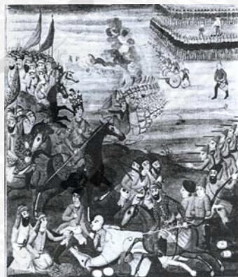
شهنشاهنامه، کتابخانه بادلیان