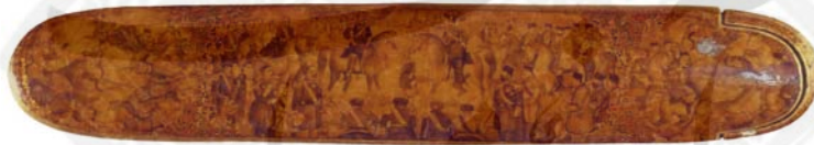
قلمدان، رقم محمدحسن افشار ۱۲۹۱ ق، موزه ملک.