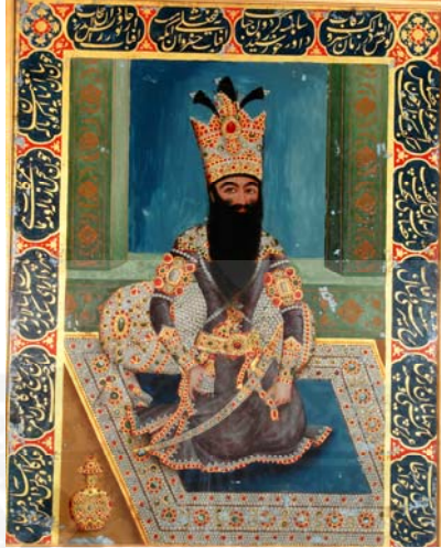
تصویر فتحعلیشاه، نقاشی پشت شیشه، با شعری در مدح وی، موزه ملک.