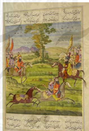
شهنشاهنامه، کتابخانه ملک، رقم محمدحسن افشار، ۱۲۵۹ ق.