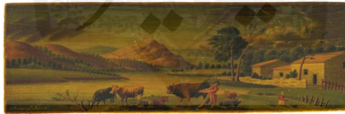
قلمدان، منظره سازی، منسوب به محمود خان ملک الشعراء، موزه ملک.