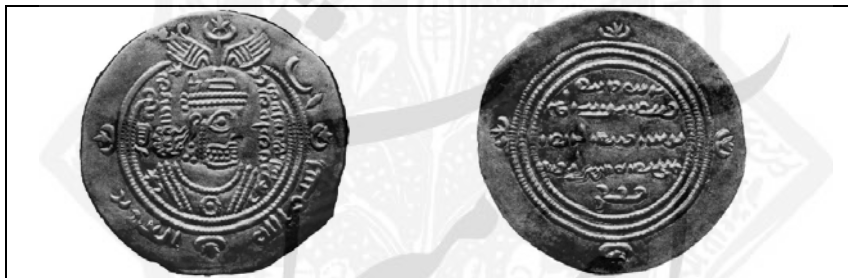
ضرب سیستان، سال ۷۲ ق

درهم سیمین دیگری نیز یافت شده که تاریخ ۷۲ ق را بر خود دارد و توسط حاکم زبیری سیستان، عبدالعزیز بن عبدالله بن عامر، ضرب شده است. این درهم سیمین نه تنها ترجمه پهلوی «محمد رسول الله»، بلکه کهن ترین ترجمه پهلوی شهادتین «لا اله الا الله، محمد رسول الله» را به دست می دهد (نک: مشیری ۱۹۸۱: ۱۶۸-۱۷۲):