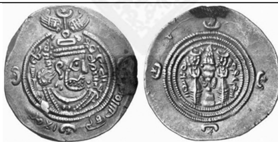
ضرب گرم کرمان، سال ۷۰ ق

چهار. در میان سکه‌های شناخته شده عرب‌ساسانی، درهم سیمین بسیار کمیابی که تصویر نمونه‌ای از آن در زیر آمده، از اهمیت ویژه‌ای برخوردار است. این سکه کهن‌ترین و شاید تنها سندی است که ترجمه پهلوی «محمد رسول الله» را به صورت mhmt pgt'mbl Y yzdt' /Mahmad paygāmbar ī yazad/ «محمد پیامبر ایزد»، می‌نماید: