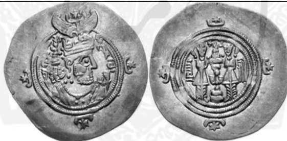
ضرب ضرابخانه دربار، سال ۲۰ سلطنت یزدگرد (۶۵۱ م)

رو: نیمرخ راست شاه، در برابر چهره شاه به خط پهلوی /Yazdgerd/ yzdkrt' «یزدگرد»، در پشت سر شاه به خط پهلوی /xwarrah abzūd/ GDE 'pzw't' «فره افزود» پشت: آتشدان و دو نگهبان در دو سوی آن، در سمت راست به خط پهلوی BBA «دربار»، در سمت چپ به خط پهلوی /wīst/ wīst' «بیست»