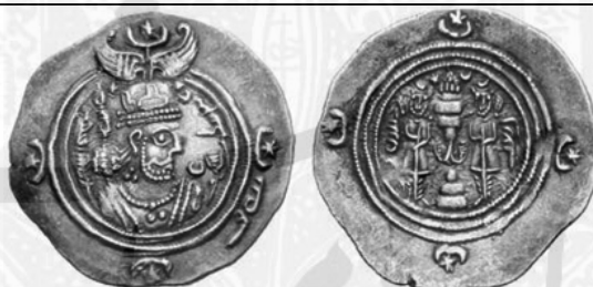
ضرب بیشاپور، سال ۱۲ سلطنت خسرو (۶۰۱ م)

رو: نیمرخ راست شاه، در برابر چهرهٔ شاه به خط پهلوی /Husraw/ hwslwb/ «خسرو»، در پشت سر شاه به خط پهلوی /xwarrah abzūd/ GDE 'pzw't' «فره افزود»، در حاشیه به خط پهلوی /abd/ pd' «أفد (= شگفت، عالی)» پشت: آتشدان و دو نگهبان در دو سوی آن، در سمت راست به خط پهلوی BYŠ «بیشاپور»، در سمت چپ به خط پهلوی /dwāzdah/ dw'cdh/ «دوازده»