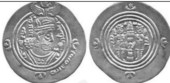
ضرب هُرمُزاردشیر (در خوزستان)، سال ۳۰ یزدگردی (۶۶۱ م، ۴۱ ق)

رو: نیمرخ راست شاه، در برابر چهره شاه به خط پهلوی /hwslwb /Husraw/ «خسرو»، در پشت سر شاه به خط پهلوی /xwarrah abzūd/ GDE 'pzw't' «فره افزود»، در حاشیه به خط کوفی «بسم الله» پشت: آتشدان و دو نگهبان در دو سوی آن، در سمت راست به خط پهلوی AW «هُرمُزاردشیر»، در سمت چپ به خط پهلوی /syh /sīh/ «سی»