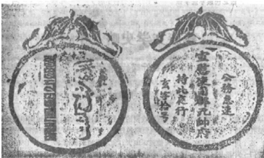
تصویر شماره ۷: پایزه مدور دوره یوان، با سه خط چینی، فارسی و فاکزپا،