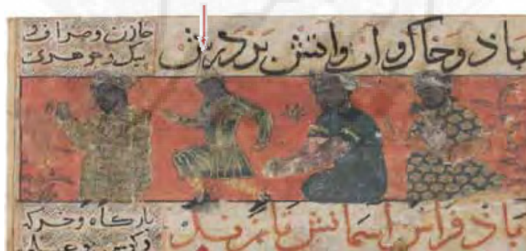
تصویر شماره ۵: برگی از مونس الاحرار موزه آرتور سکالر، شماره ۱۹۶۰ (۱۸۹) ر)،