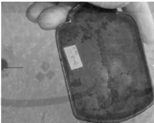
تصویر شماره ۶: تصویری دیگر از پایزه موزه بنیاد مستضعفان

می‌شد، قاعدتاً می‌بایست در دارالضرب‌ها تولید می‌شد. دربارهٔ اسباب دارالضرب و کارکنان آن، رسالهٔ فلکیه، تألیف ۸۰۶ق، اطلاعات بیشتری می‌دهد. از این رسالهٔ مهم، نسخه‌ای در کتابخانهٔ مجلس موجود است ۱ و نسخه‌ای دیگر را نیز والتر هینتز ۲ با حروف چینی و نمایه‌ها در ۱۹۵۲ در آلمان منتشر کرده است.