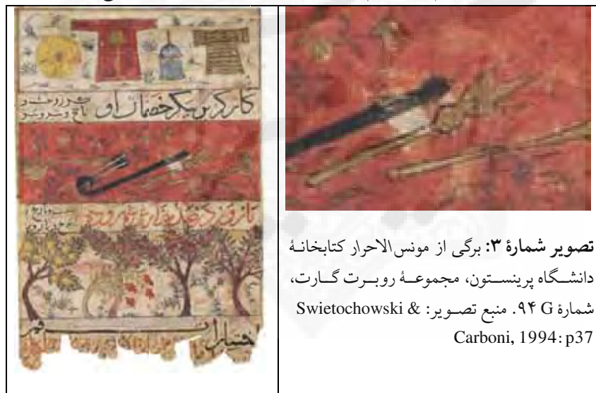
تصویر شماره ۳: برگی از مونس الاحرار کتابخانه دانشگاه پرینستون، مجموعه روبرت گارت، شماره G ۹۴.