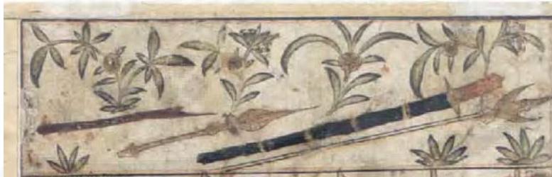
تصویر شماره ۴: برگی از مونس الاحرار موزه آرتور سکالر، شماره ۱۹۶۰ (۱۸۹) پ)،

اگر پایزه را مانند سکه به دو قسمت پشت و رو تقسیم کنیم، روی آن را طرفی قرار می‌دهیم که نام سلطان آمده است. یک طرف پایزه در وسط فقط نام سلطان، و طرف دیگر، دو سطر نوشته در دو طرف تصویر پیک آمده است. روی پایزه موزه بنیاد مستضعفان یک سطر نوشته دیده می‌شود: «سلطان ابوسعید یرلیغ منو». در سمت چپ این نوشته اویغوری و در انتهای عبارت، با فاصله اندکی سورشارژی کوچک دیده می‌شود که خوانده نشده است و شاید مربوط به تمدید و تأیید دوباره پایزه و یا همان نقشی باشد که در متن ذیل منقول از تاریخ مبارک غزانی برای تشخیص پایزه اصل با مطرقة در پایین آن کوبیده می‌شده است و با فن حک کتیبه اصلی متفاوت است. ۱ این سورشارژ در پایین و نزدیک اسم سلطان قرار دارد.