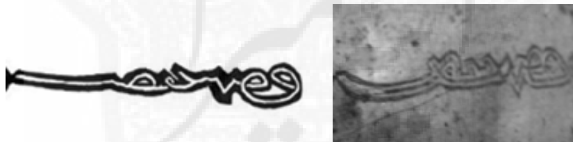
نگارش واژه «بوسعیدا» در هر دو پایزه (سمت راست: پایزه موزه بنیاد؛ سمت چپ: پایزه موزه ملی)

البته این قرائت با آنچه آقای قوچانی از قول دو کارشناس (یکی چینی و دیگری فرانسوی) که متن را برای ایشان خوانده‌اند متفاوت و احتمالاً صحیح‌تر است. در نوشته‌های روی پایزه حکمی دستوری دیده می‌شود که در متن پیشنهادی آقای قوچانی وجود ندارد. اما در بازخوانی متن، این دستور در آخرین قسمت هر دو پایزه دیده می‌شود. برای شناخت بهتر این الواح ضروری است متن پایزه‌های بیشتری خوانده شود. به غیر از جنس پایزه، تفاوت‌های دیگری هم در این دو پایزه دیده می‌شود. متن پایزه