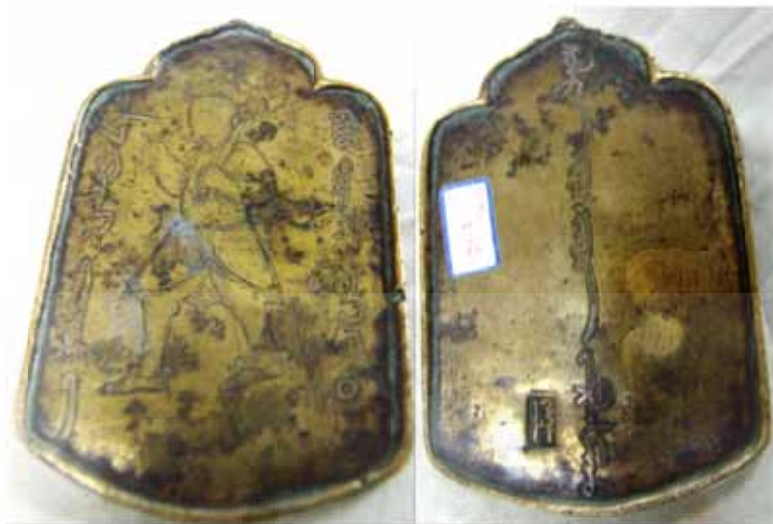
تصویر شماره ۲: پایزه موزه بنیاد مستضعفان، شماره ثبت: ۴۸۰۴۳، ردیف ۱۵۰۱۴، اندازه اعلام شده: ۸×۶ سانتیمتر، وزن: ۹۳/۴ گرم، جنس اعلام شده: برنز [۴]، محل نگهداری: خزانه تماشگاه تاریخ ۱