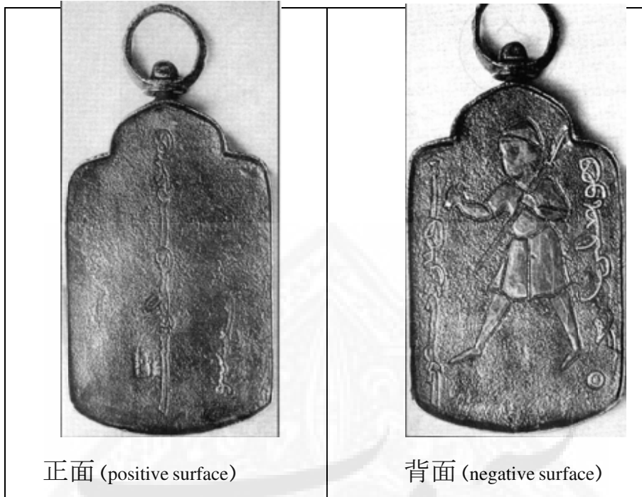
تصویر شماره ۹: مأخذ: قوچانی، ۱۳۷۶