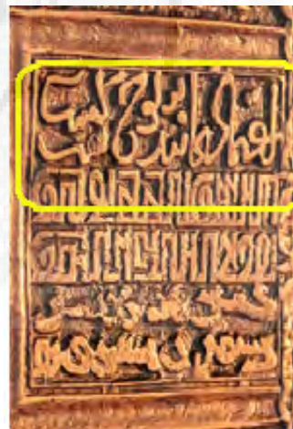
تصویر شماره ۸: پایزه موزه ملی مغولستان