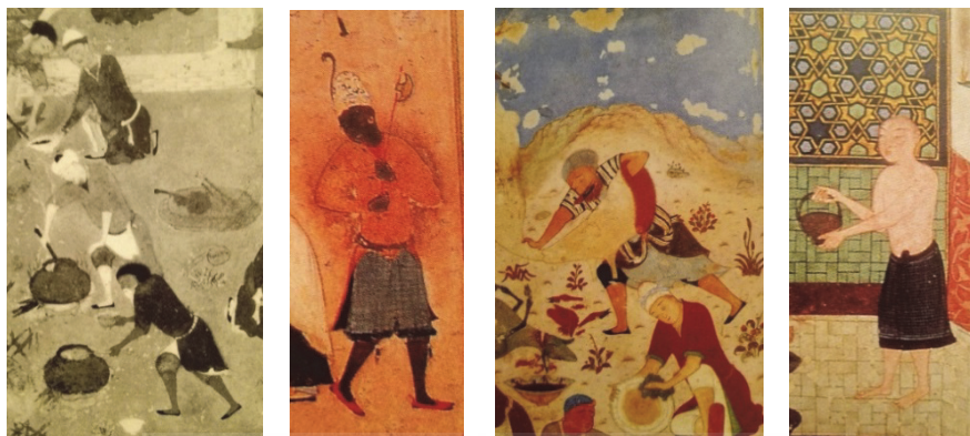
شکل‌های ۷، ۸، ۹ و ۱۰ (به ترتیب: از راست به چپ). نمونه‌هایی از سبک بهزادی؛ تصاویری از توده مردم و مردمانی از لایه‌های میانه‌حال یا فرودست جامعه (مأخذ: Bahari, 1997: 114, 116, 135, 92).

نقاش سبک بهزادی، آنجا هم که اصل شعر به چنین فضایی تعلق ندارد، آن را به سود جهان‌بینی و عقاید مردم‌گرای خود تغییر می‌دهد. نمونه‌ای از چنین استحاله‌ای در نگاره «شیخ مهنا و پیرمرد روستایی» دیده می‌شود که تعبیری مصور از حکایت عارفانه منطق الطیر عطار به رخدادی کاملاً عامیانه است. نقاش به شکلی بسیار ظریف به صنف ترازوداران فتوت توجه نموده است، به گونه‌ای که موضوع اصلی داستان به کناری نهاده شده و شخص ترازودار به قهرمان اصلی تصویر مبدل شده است. خواجه ترازودار از شخصیت‌های مهم و مشهور اهل فتوت، و هم‌شان جوانمرد قصاب محسوب می‌شود.