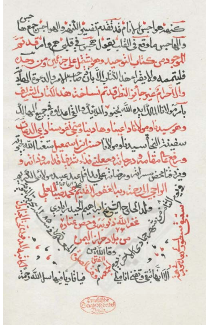
تصویر ٢: برگ پایانی نسخه کتابخانه دولتی برلین، به شماره Ms. or. oct. 2958