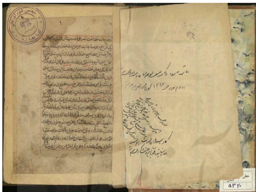
تصویر صفحه نخست نسخه ۵۳۲۰ کتابخانه مجلس