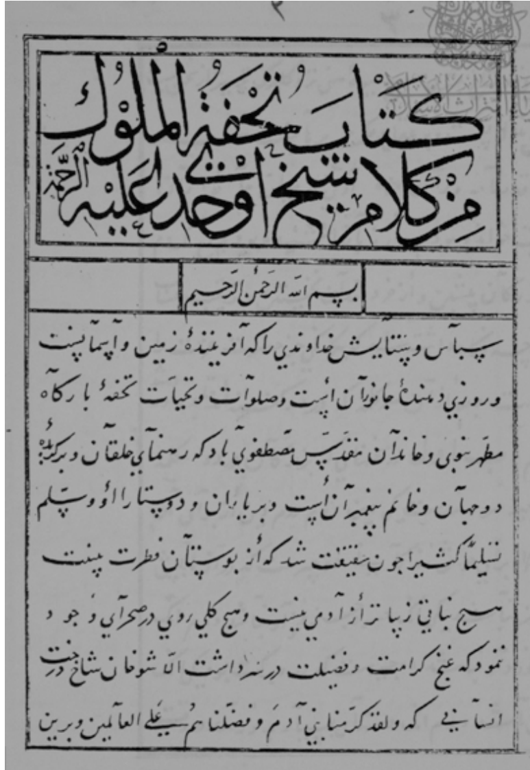
تصویر صفحه آغاز نسخه خطی تحفة الملوك اوحدی (کتابخانه واتیکان (رُم) ش ۹ فارسی)